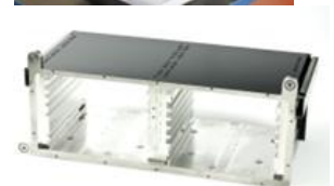
Quelques exemples de pièces au sein de notre site de Saint-Hilaire-de-Voust

Contact : Madame Stacy LAVOIE, s.lavoie@jcbouy.fr // 02.51.53.10.10