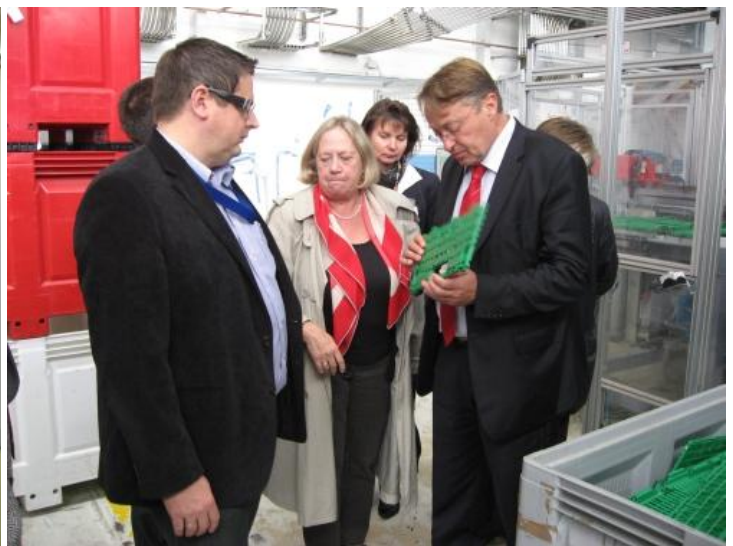
Unternehmen Schoeller Arca Systems GmbH